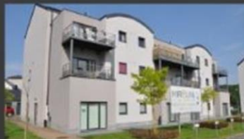
Rue des Alliés à Libramont

Une équipe de 21 personnes dont 12 chargés de projet et 2 chargés de relations entreprises